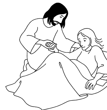
Père Didier TSHIBANGU

Encourageons les élans de solidarité. Seule une réponse généreuse à l'endroit de ses fléaux humains peut donner un coup de pinceau digne d'une société du vivre-ensemble.