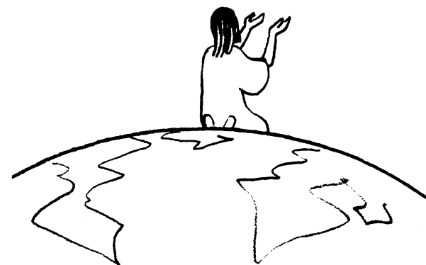
Père Didier TSHIBANGU

Le pape François, à tous égards, est celui qui apporte une lueur d'espoir d'un monde pacifique lorsqu'il demande à tous une conversion intégrale et globale de la personne et du monde.